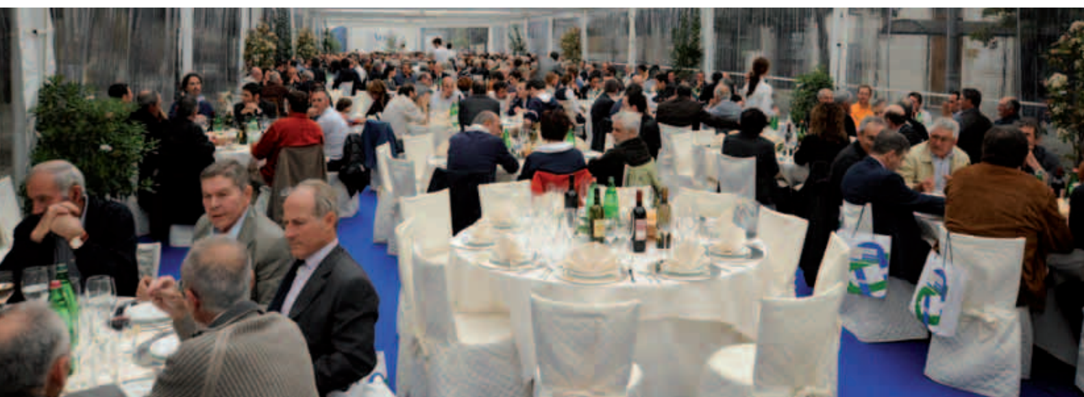
Un momento del pranzo sociale