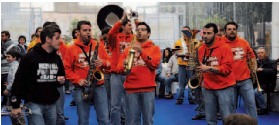
La Banda Musicale

vato ai Soci, i quali hanno ricevuto in dono il volume del Centenario, il portachiavi del Centenario ed il dvd “Le Vie del Tufo e della Pietra”, trasmissione televisiva TV9, promossa dalla Banca nell’ottica di valorizzazione del territorio. Nel pomeriggio grande partecipazione di tutta la popolazione per il ricco buffet, allietato da musica ed intrattenimenti con il gruppo di animatori anche per i più piccoli. La serata si è protratta fino a tarda sera con lo spettacolo di “Teatro da Strada” con effetti pirotecnici. Questa festa collettiva ha dato l’occasione di ripercorrere i capitoli di una storia che ha segnato profondamente lo sviluppo del nostro territorio, creando l’opportunità per tutti i partecipanti di riflettere su come la storia è viva quando si intreccia col vissuto delle persone, e che solo attraverso la sua conoscenza è possibile sviluppare quel senso di appartenenza e quell’orgoglio che sono la condizione indispensabile per incidere positivamente nel sociale.