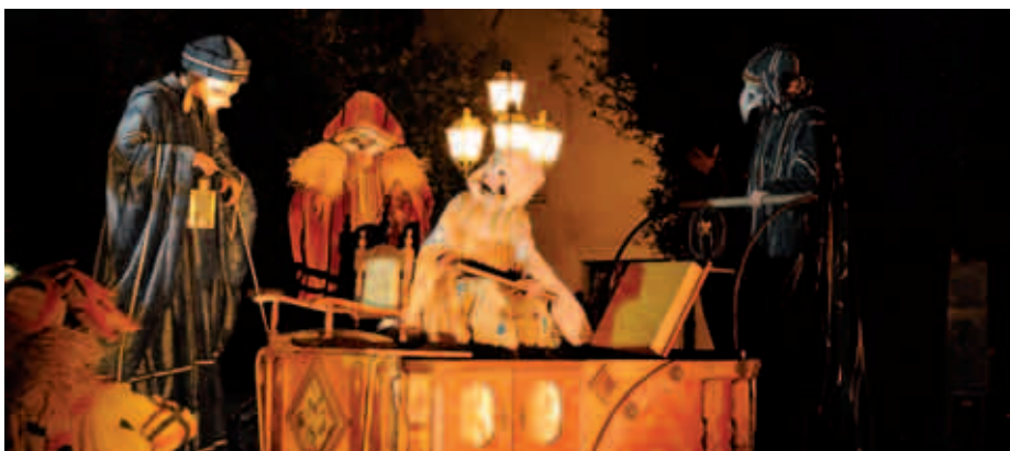
Giada Valoriani Uno scorcio dello spettacolo serale