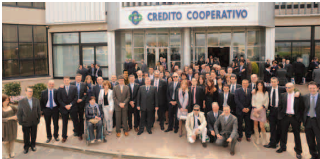
Dipendenti e Consiglio di Amministrazione della BCC di Pitigliano

l'Avv. Azzi, il quale si è soffermato sul futuro della Banca, che deve affrontare quotidianamente le scommesse della globalizzazione e della crisi economica con la giusta preoccupazione e consapevolezza, ma anche con la profonda convinzione che nei principi fondatori delle BCC è insita quella capacità di saper fronteggiare i momenti più difficili. Nel recupero delle proprie origini, ovvero il legame col proprio territorio, sta la formula per affrontare il futuro. La festa è proseguita infine presso la struttura delle Terme di Saturnia con il pranzo aperto a tutti gli intervenuti e agli ospiti presenti in sala.