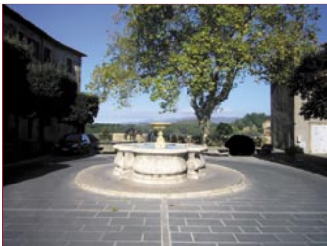
La piazza di Pitigliano

Nella fase di allestimento della nuova agenzia, particolare attenzione è stata riservata alla disposizione degli spazi e alla collocazione dei servizi, al fine di rendere l'ambiente più razionale per gli utenti e più funzionale per gli operatori.