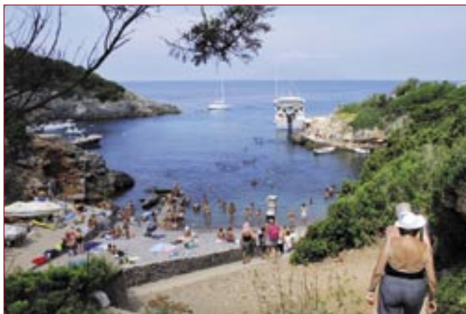
Isola di Giannutri

L'estate 2008 ha visto come protagonista un'interessante iniziativa per coinvolgere tutti i suoi Soci e Clienti. Sabato 26 luglio si è tenuta, a tale proposito, la mini-crociera alle isole del Giglio e di Giannutri. Le mini-crociera, con partenza da Porto Santo Stefano, è durata un'intera giornata, e ha compreso un ricco pranzo di pesce a bordo. Il gruppo partecipante alla gita ha passato un'incantevole e piacevole giornata di mare, alla quale si è unita la scoperta del paesaggio naturale di due tra le più belle isole d'Italia.