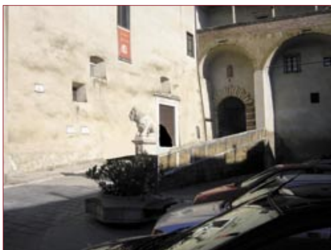
L'ingresso della Sala Petruccioli

La "Sala Petruccioli", posta all'interno dello splendido Palazzo "Orsini", è stata teatro, in passato, di numerose assemblee dei soci, ed ora è un punto di riferimento per iniziative culturali-sociali. Intitolata all'ingegner Francesco Petruccioli, primo presidente, dal 5 aprile 1909, della Cassa Rurale di Pitigliano, la "sala", dopo molti anni, sarà finalmente rimessa a norma.