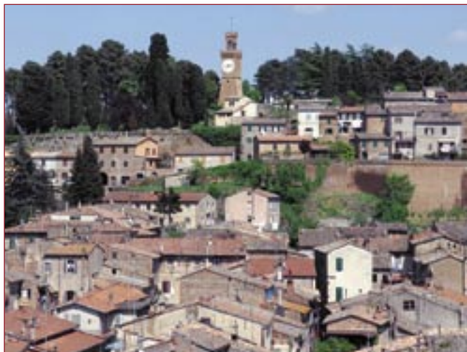
Panorama di Acquapendente

La nuova agenzia esprime nell'allestimento degli spazi una sintesi tra innovazione e qualità; una "banca aperta" che offre maggiore consulenza, che pone attenzione ai bisogni dei suoi clienti e che garantisce servizi efficienti e funzionali.