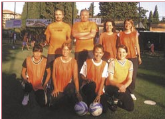
La squadra di calcetto femminile della BCC di Pitigliano

La Banca di Credito Cooperativo di Pitigliano conferma la sua passione per i "giovani talenti" e il valore aggregante dello sport: quest'anno, dopo la squadra maschile di calcetto a 5, la quale ha preso parte al sesto Torneo nazionale di calcetto delle BCC, si è formata anche la squadra femminile di calcetto a 5.