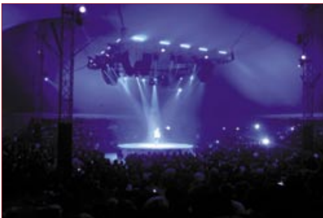
Un momento del concerto di Gianni Morandi

Lo spettacolo, che ha avuto luogo al Teatro Tenda Lotto piazzale Clodio, alle 21, ha rappresentato un'occasione straordinaria per tutti i partecipanti all'evento e ha confermato l'interesse dell'Istituto di Credito per la cultura, la musica e l'arte in generale. Morandi è infatti un'icona, il volto pulito della musica leggera e della più nobile cultura nazionalpopolare. Una sola chitarra sul palcoscenico del Tenda Lotto piazzale Clodio di Roma e circa quaranta brani intonati da uno dei più celebri cantanti italiani di tutti i tempi: sono stati questi gli ingredienti fondamentali per uno spettacolo all'insegna della musica e dei ricordi. Un concerto mozzafiato che non ha deluso gli appassionati del genere musicale.