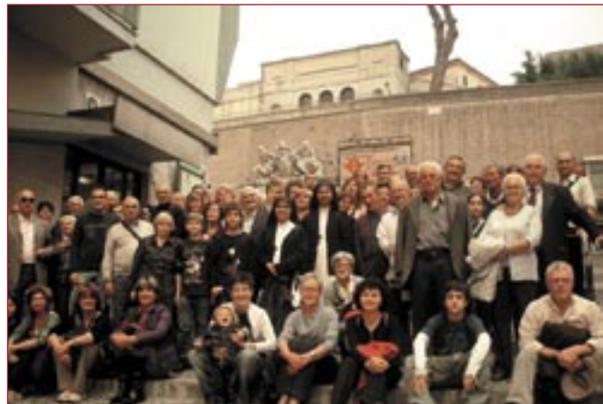
Il gruppo partecipante alla gita ai Musei Vaticani

l'enorme collezione di opere d'arte accumulata nei secoli dai Papi. La gita, ha rivestito un significato ancora più profondo dal momento che in occasione del pellegrinaggio del 25 ottobre si è tenuta, nei pressi della Basilica di San Pietro, l'udienza con il Cardinale Angelo Comastri, presidente della Fabbrica di San Pietro e vicario generale di Sua Santità per la Città del Vaticano. Il Cardinale Angelo Comastri, originario di Sorano, ha rappresentato per lunghi anni il punto di riferimento spirituale del nostro territorio, pertanto l'in-