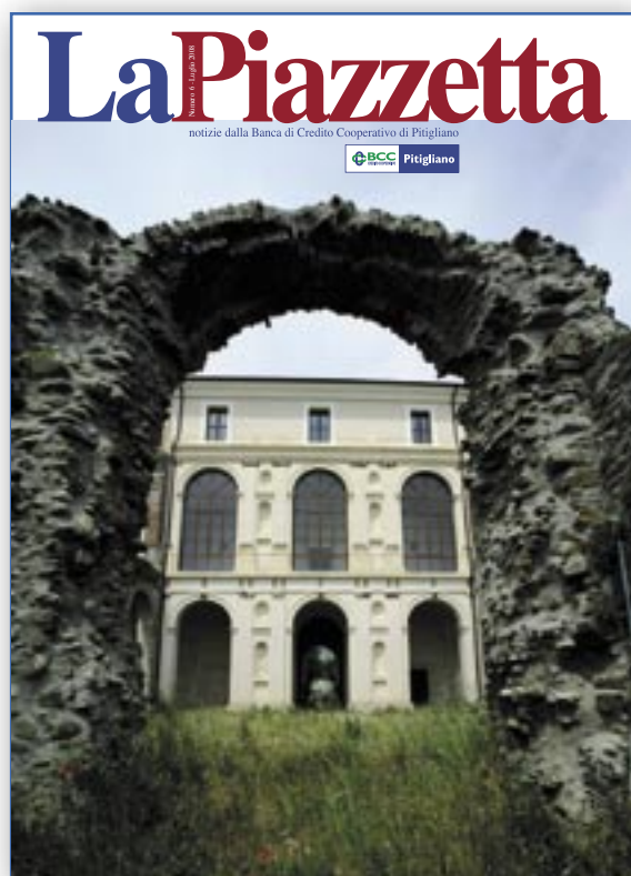
Numero 6 - Luglio 2008