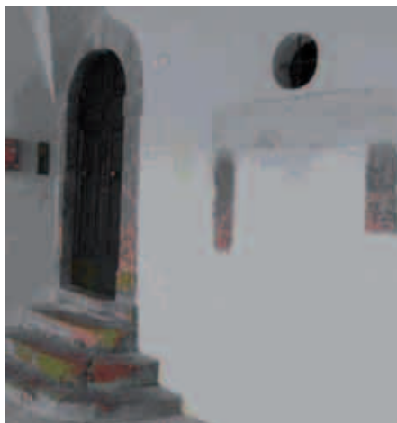
Loggiato, colonna in pietra con incise misure lineari Senese e Pitiglianese, Sec. XVI

continui e misure lineari espresse in "Mezza Canna", riferiti al secolo XVI. La collocazione della pietra, forse in passato ubicata poco distante dal loggiato, lascia supporre il trasferimento dalla sede originale all'uso architrave, e per la sua particolare funzione di campitura fu utilizzata per le costruzioni di edifici e per le misurazioni agrimensori, indirizzandoci a nuove e interessanti approfondimenti dei tracciati geometrici ordinatori. Nella città di Lucca presso la facciata di S. Cristofano ritroviamo analoghe caratteristiche: i modelli della "Canna e Mezza Canna" erano infissi nel muro sin dal secolo XIII, in uso per misurare la stoffa. A Firenze i tessuti acquistati nelle botteghe venivano tagliati secondo l'unità di misura lineare detta "Canna di Calimala", una sorta di asta corrispondente a quattro braccia, ossia 2 metri e 33 cm. La "canna castrense" (che consistente in una verga in ferro), datata al secolo XV, originariamente posta sotto le volte del portico comunale e attualmente collocata nel museo di Valentano (VT), risentiva ancora dei sistemi di misura locali di origine medievale, che ripartita in dodici piedi, si differenziava nella misura dagli altri comuni appartenenti al Ducato di Castro.